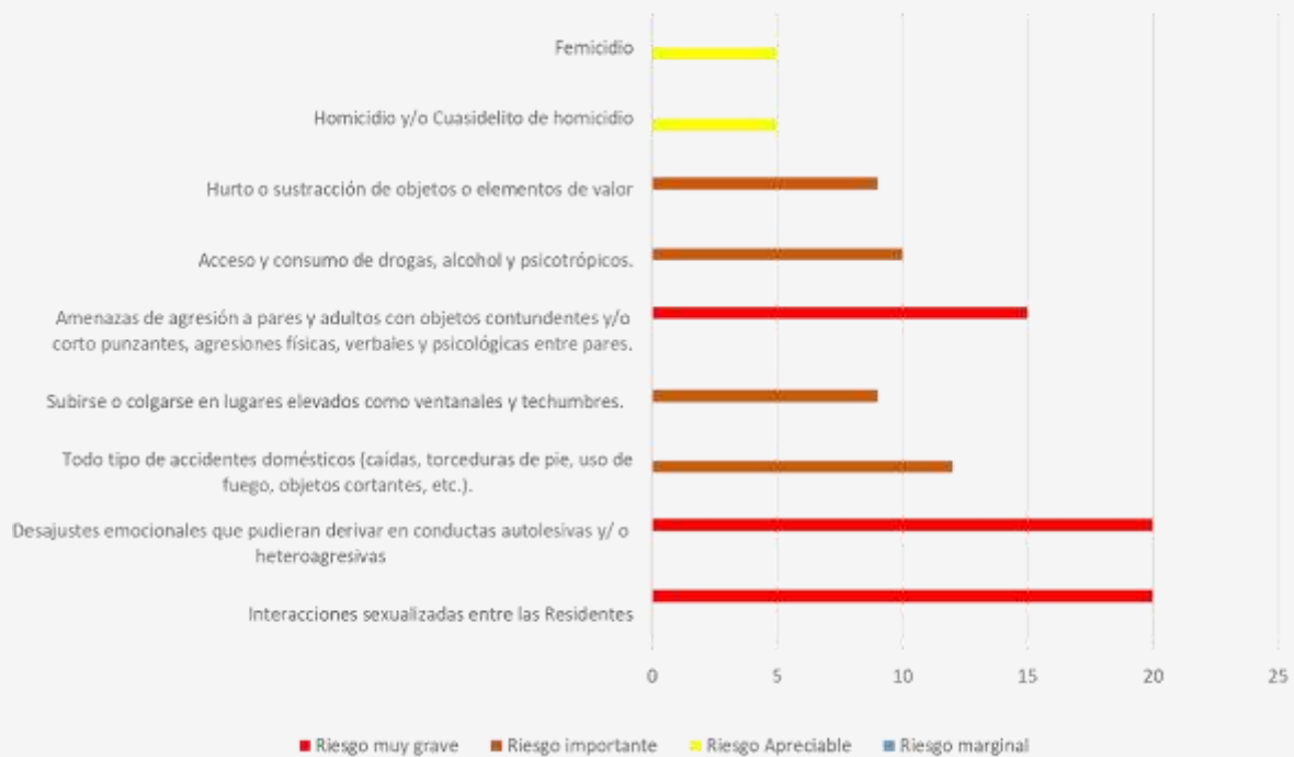
Intervención en situaciones cotidianas y entre pares de la residencia.

Crear charlas preventivas, seguridad perimetral, utilización de cámaras de seguridad y facilitar la entrega de información a las residentes sobre los canales de denuncia.