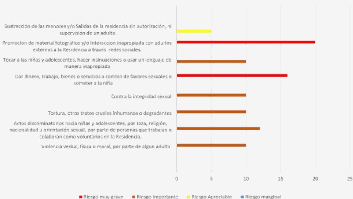
Intervención directa con NNA: Descripción de los intervinientes.

En este punto las ETD cumplen también un rol importante frente al constante seguimiento y acompañamiento con el grupo de niñas, con esto también se trabaja con un calendario y horarios para ir monitoreando donde se encuentran las niñas.